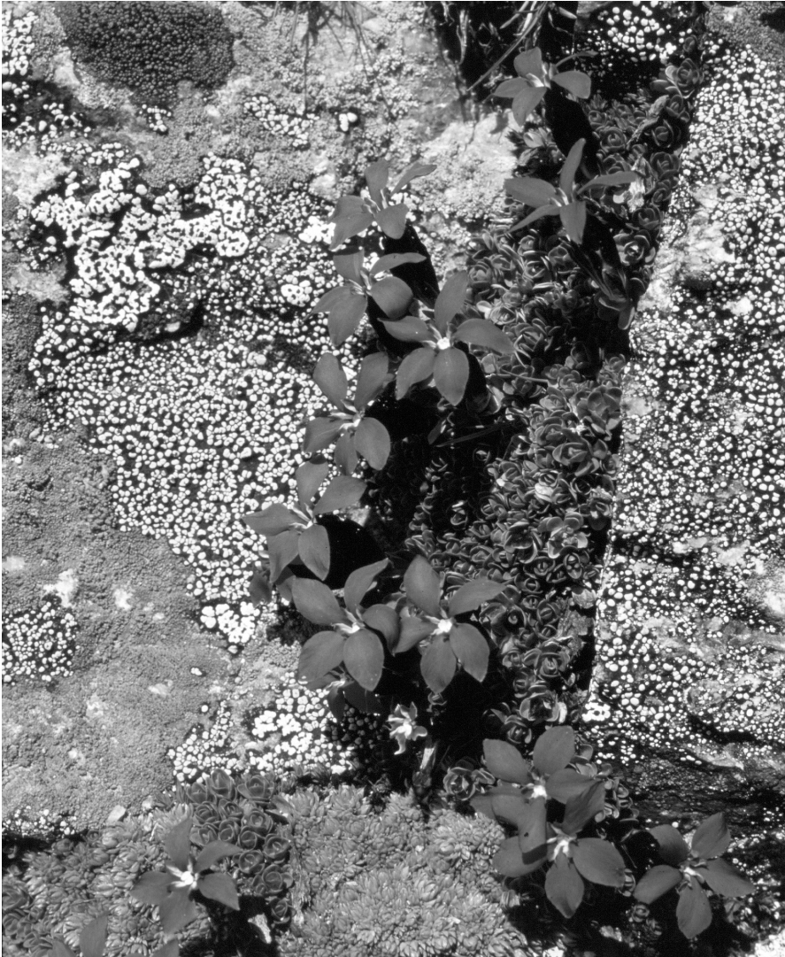
Spring Gentian / Gentiane printanière / Gentiana verna / Frühling-Enzian

„The UIAA recognises the enormous value of mountain areas as reservoirs of biological diversity...” (art.5, p.5)