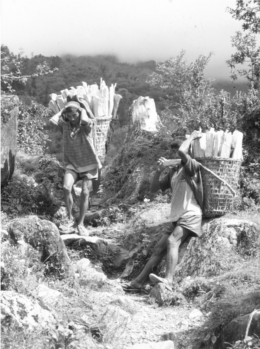
Porters bringing firewood for tourist showers, Khumbu Region, Nepal-Himalaya

„The overuse of sensitive areas...” (art.12, p.9)