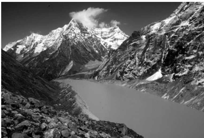
Tsho Rolpa lake at the front of the Trakarding Glacier, Rolwaling valley, Nepal Himalaya. A glacier 30 years ago – a potentially dangerous glacial lake now, due to climate change.

Partiendo de la Declaración de Katmandú se aborda el tema de las expediciones, definiendo directivas para el comportamiento de sus participantes antes, durante y después de una expedición, no sólo en cuanto al medio ambiente. Los puntos más importantes: respeto a las leyes del país anfitrión, cumplimiento de la Declaración de Katmandú, renuncia al uso excesivo de materiales, ausencia de dopaje, informes imparciales, solidaridad, abstención de contaminación de la montaña por basura.